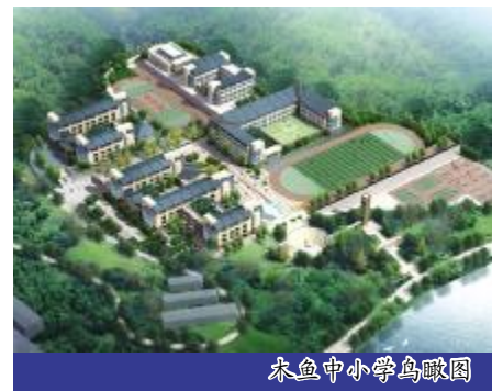
木鱼镇中小学鸟瞰图

木鱼中小学选址于白龙湖北岸的威虎山(木鱼中学原址), 按目前国家标准抗震设防烈度8度进行设计, 为浙江省全额投资类项目, 四川省重点工程, 总占地面积68亩, 总建筑面积20783平方米, 投资概算5100万元, 建成后可容纳2000余名学生就读。