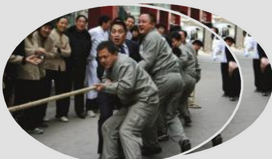
3月3日,南京曙光国际大酒店举行了庆“三八”员工文体活动竞赛,内容包括象棋、围棋、乒乓球、拔河等文体项目,酒店员工在活动中表现出了很高的热情,踊跃参与。