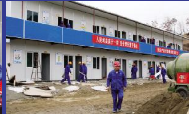
5月7日上午,经过40多天的奋战,崭新的活动板房终于顺利完工,图为施工人员在清理现场。