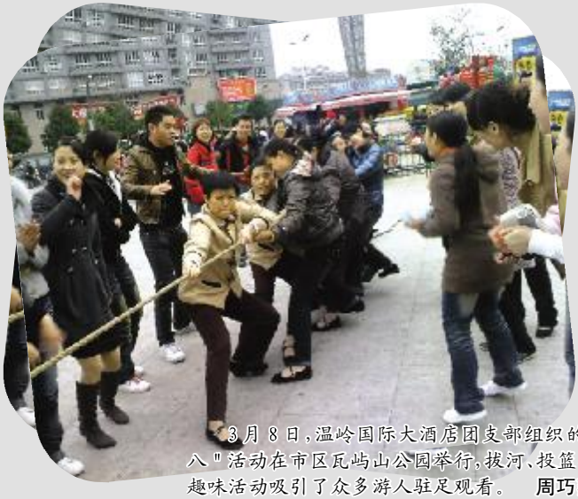
3月8日,温岭国际大酒店团支部组织的庆“三八”活动在市区瓦坞山公园举行,拔河、投篮、跳绳等趣味活动吸引了众多游人驻足观看。