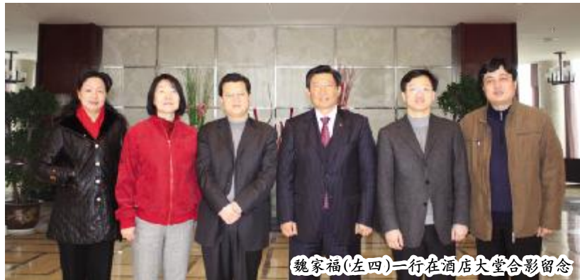
魏家福(左四)一行在酒店大堂合影留念

示十分满意,并即兴题词:“宾至如归,句容第一”。魏家福,中国远洋运输集团总裁、博鳌亚洲论坛理事、中共中央纪律检查委员会委员,曾被美国《商务周刊》评选为2005年度全球航运和物流行业领袖人物,在全球商界广受尊重。