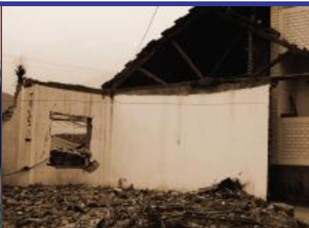
木鱼小学坍塌的宿舍。公司施工队的简易厨房就设在这堵白色的危墙后。