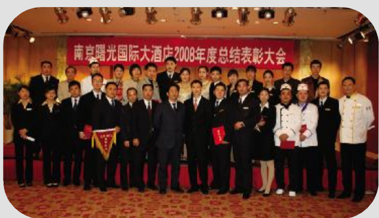
1月18日,南京曙光国际大酒店2008年度总结表彰大会召开,总结经验、表彰先进,会后,酒店领导和获奖员工合影。

多了一份理解,自然少了一份抱怨;少了一份抱怨,自然多了一份快乐。乐观积极、奋发向上的心态总会让你保持一颗年轻的心,总会让你的周围聚满朋友,总会让“幸运之神”对你格外亲睐。今天,董事长教我们“快乐做事、快乐做人”,就是要我们以自己的行动去影响别人,用自己的大度去包容别人,时刻牢记“我为人人”的理念,从而让自己永远保持积极向上的心态。