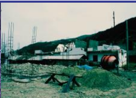
木鱼镇上坍塌的民房。