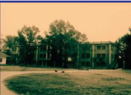
吞噬了293条生命的原木鱼中学宿舍楼。