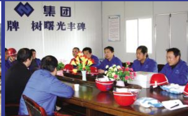
新建的工地会议室里,江董事长亲自主持召开项目部会议,向公司赴川的建设者们表示慰问并部署工作。